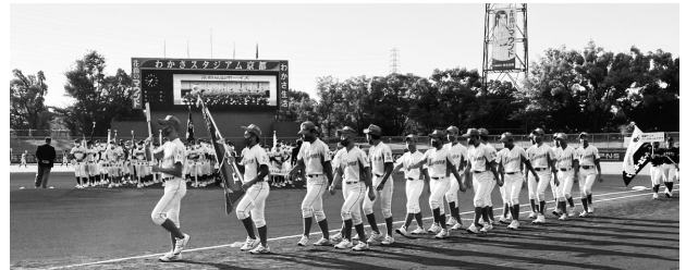
写真は、昨年の第4回大会開会式

京都府内、及び滋賀県内の中学硬式野球チームが参加して行なうトーナメント大会。今年の第5回の大会日程については、11月4日（土）アイアイ伏見桃山スタジアムで開会式が挙行される。それ以降の大会日程については未定、決り次第、野球協会ホームページに掲載する。