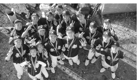
京都リトルシニア

又四強には湖南ポイズを破った綾部シニアと京丹後洛南ポイズを破った南山城ポイズが入った。三リーグの二回戦での対戦を見るとポイズ対シニアは七勝三敗でポイズ、ポイズ対ヤングは二勝一敗でポイズ、シニア対ヤングは一勝〇敗でシニアという結果になっていた。