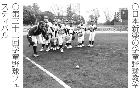
○第三十三回学童野球フェスティバル

府内各支部や連盟の代表十六チームで開催。北白川ベアーズが翔鷹少年野球クラブを六回で破り優勝を飾る。又四強には橋本クラブ(八幡市)長岡京B野球クラブ(八幡市)が入った。